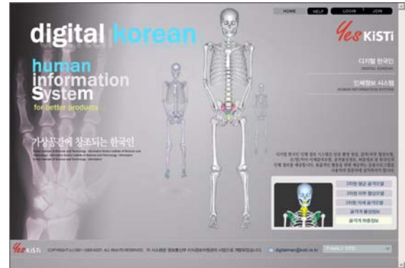
Fig. 2 Digital korean homepage http://digitalman.kisti.re.kr

정보연구원이 주관하는 지식정보사업의 일환으로 가톨릭응용해부연구소가 수행하였으며, 구축된 정보는 한국과학기술정보연구원(KISTI) 홈페이지를 통해 서비스 되고 있습니다(Fig. 2).